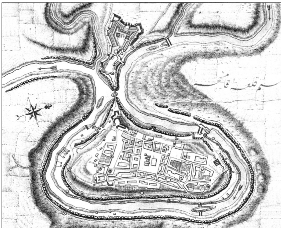
Ryc. 4. Plan Kamieńca Podolskiego, Biblioteka Narodowa, ZZK 1 324

w litej skale około 1715 r., 29 a zamurowany około 1773 r. 30 , mur zwany od nazwiska projektanta glowerowskim, budowany w latach 1721–1725 oraz 1734–1735, zabezpieczający miasto do strony południowej, nadszańiec – bateria Św. Józefa – zbudowany w 1746 roku 31 jako kolejny bastion osłaniający most łączący zamek z miastem. Czyli plan powstał po 1746, ale przed 1773 rokiem. Warto zauważyć, że w chwili gdy ten plan powstawał, Kamieniec Podolski nie należał już do Turcji od około pięćdziesięciu lat.