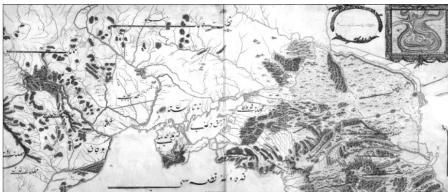
Ryc. 1. Mapa granic Imperium Osmańskiego