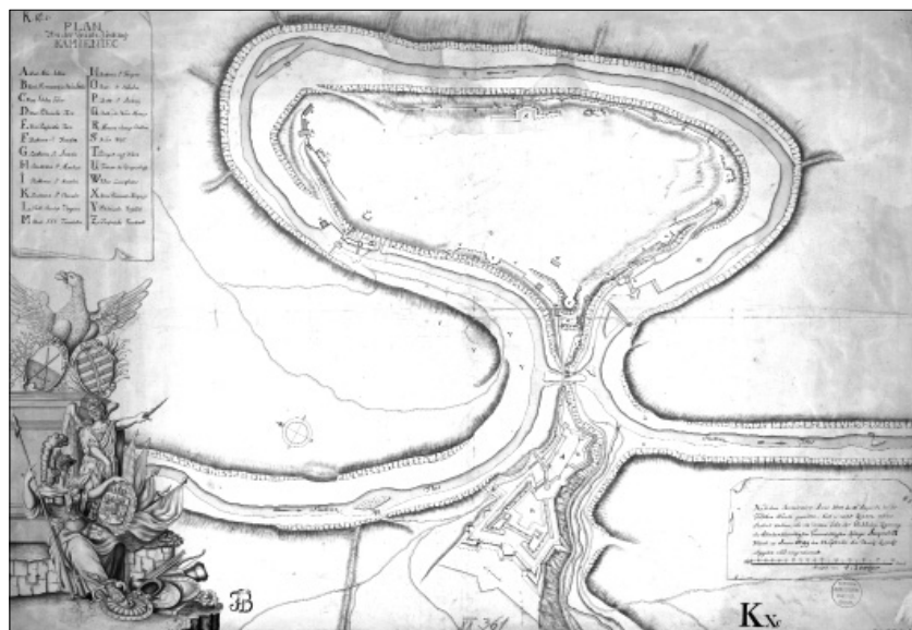
Ryc. 2. Plan Kamieńca Podolskiego Christiana Dahlke, StaatsBibliothek zu Berlin, IIC kart X 48809

Dlatego przy próbie odtworzenia zaginionego planu posłużono się jako podkładem planem Jana de Witte, a nie Christiana Dahlke. Trzeba jednak zauważyć, że zakres robót budowlanych podanych w Eksplikayi jest nieco szerszy niż w przewidzianych w Projekcie Remonstracyjnym . Zatem w chwili, gdy powstawał zaginiony plan, myślano o bardziej długoterminowym zabezpieczeniu fortecy.