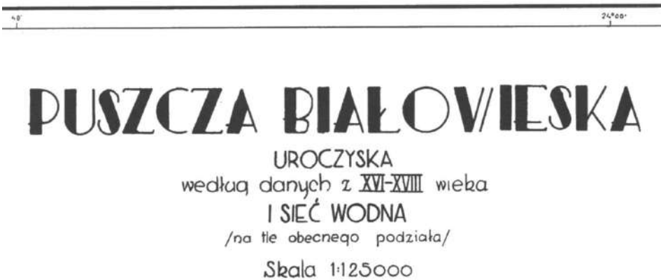
Ryc. 1. O. Hedemann, Uroczyska według danych z XVI-XVIII wieku i sieć wodna (na tle obecnego podziału) , skala 1:125 000, 1939, tytuł mapy

Uroczyska według danych z XVI-XVIII wieku i sieć wodna (na tle obecnego podziału) . Skala 1:125 000. Mapa zawiera nazwy uroczysk, czyli terenów eksploatacji Puszczy, w tym także ostępów i wchodów, ale bez nazw większych jednostek administracji leśnej (kwater i straży).