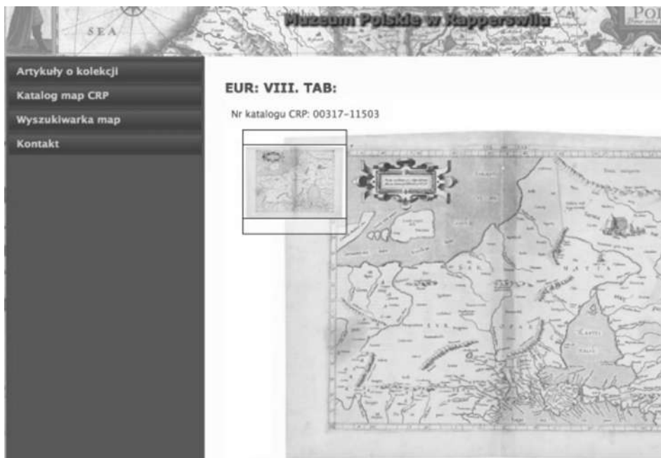
Ryc. 9. Katalog. Widok użytkownika. Podgląd podstawowy