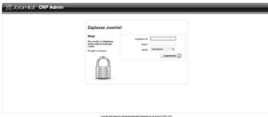
Ryc. 1. Katalog. Widok administratora. Strona logowania administratora