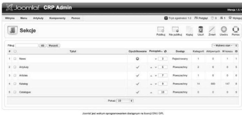
Ryc. 3. Katalog. Widok administratora. Wybór sekcji