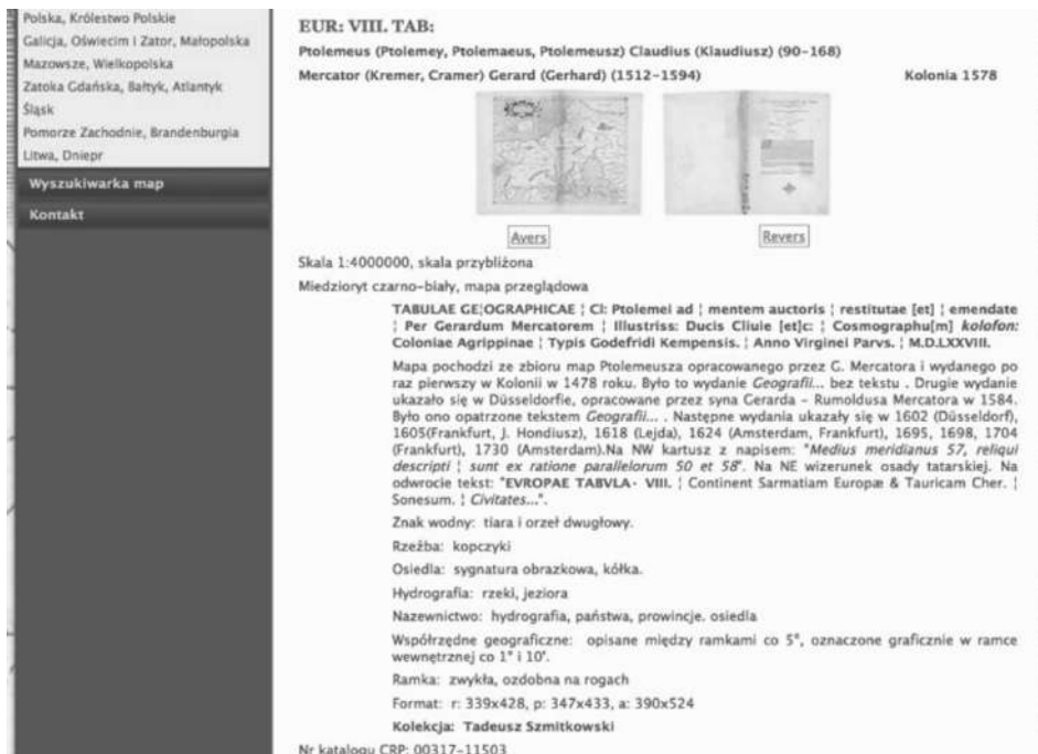
Ryc. 8. Katalog. Widok użytkownika. Detale wybranego obiektu