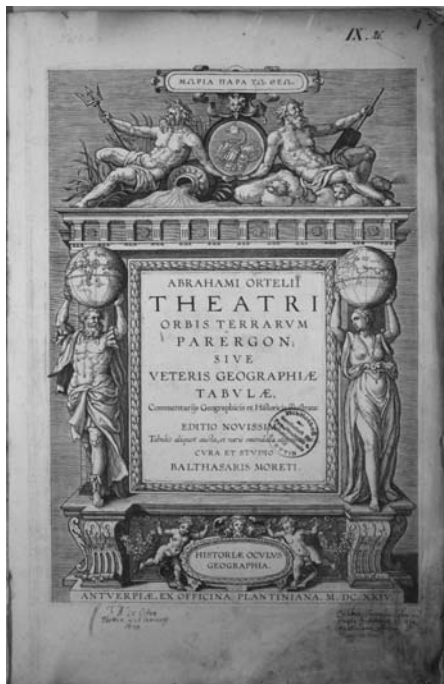
Ryc. 1. Atlas Abrahama Orteliusa – strona tytułowa