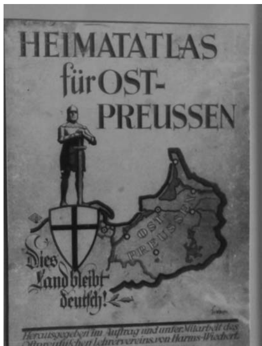
Ryc. 1. Haimatatlās für Ost-Preussen , Leipzig – Königsberg 1926 – strona tytułowa